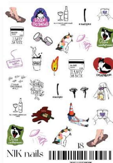
СЛАЙДЕР-ДИЗАЙН NIK NAILS 18