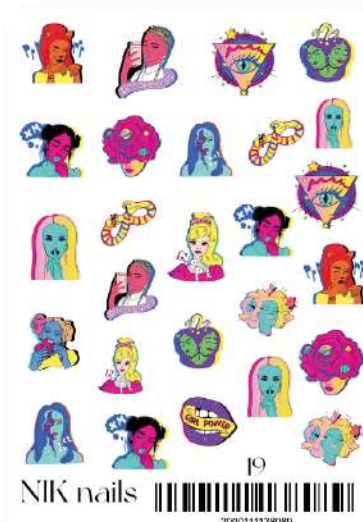
СЛАЙДЕР-ДИЗАЙН NIK NAILS 19