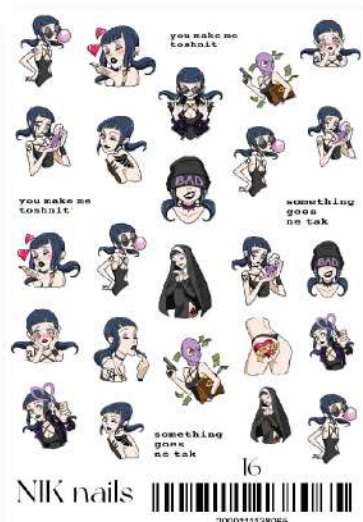
СЛАЙДЕР-ДИЗАЙН NIK NAILS 16